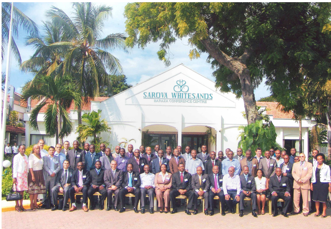
UPDEA - 3rd MEETING OF THE SCIENTIFIC COMMITTEE AT WHITESANDS HOTEL JULY 4-6 2011 MOMBASA KENYA.

D'autre part, le colloque sur les énergies renouvelables et l'efficacité énergétique prévu à Tripoli (Libye) dans le courant du mois de Février 2011 n'a pas pu se tenir en raisons de contraintes survenues à la fois en Côte d'Ivoire et en Libye.