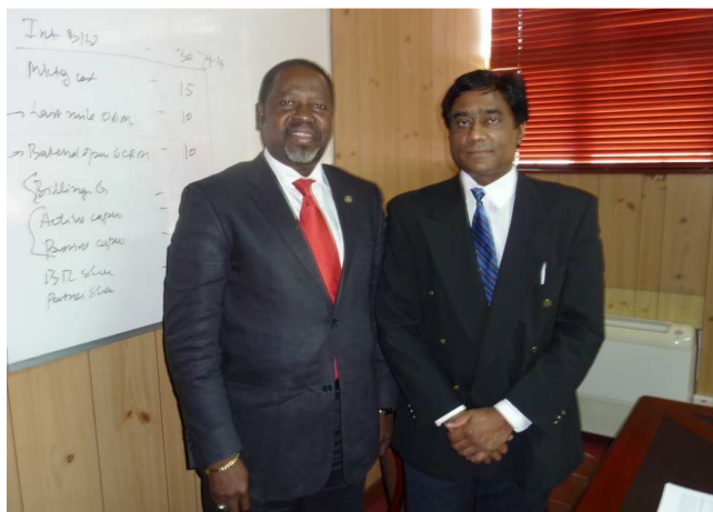
Monsieur le Secrétaire Général de l'UPDEA et Monsieur le DGA de CEB île Maurice

Enfin, comme convenu avec le Président, une invitation spéciale a été faite en primeur aux autorités de la CEB pour le prochain Congrès.