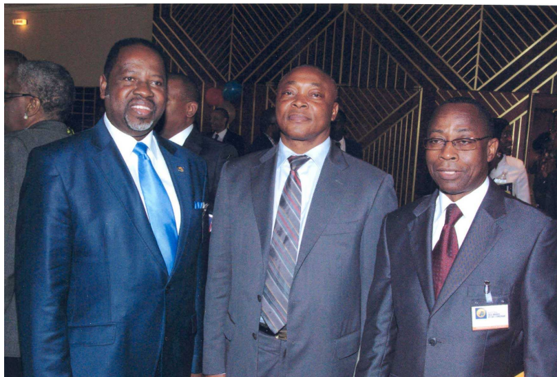
Monsieur le Secrétaire Général en compagnie des DG de SOPIE et de ANARE